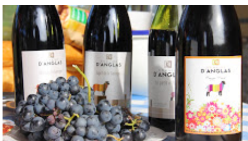
Nos vins.jpg 1216K