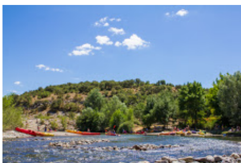
Notre rivière . l'Hérault !.jpg 454K